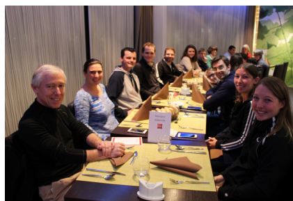
Des moments de détente...on ose se lâcher !