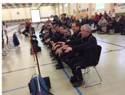
La Ola du MOP en finale !